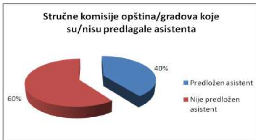
Grafikon broj: 2

2.1.1. Prvostepene stručne komisije iz 21 grada/opštine predlagale su asistenta u nastavi, dok komisije iz 32 grada/opštine nisu predlagale angažovanje asistenata.