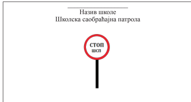
Таблица за регулисање саобраћаја